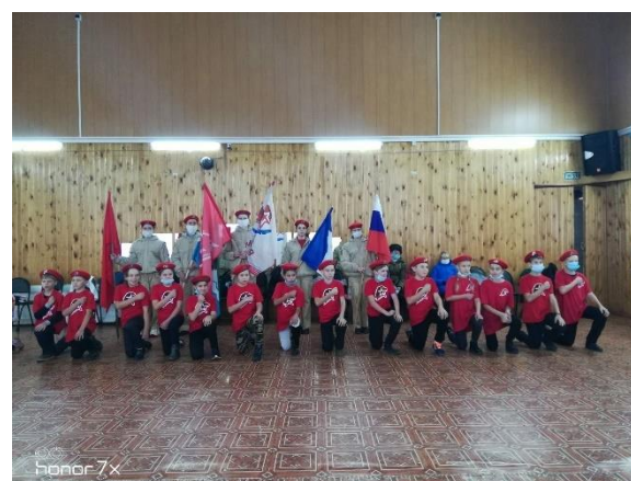
На фото: юнармейцы Тангуйской школы