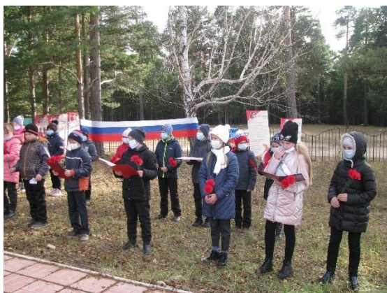
На фото: ребята готовятся к произнесению клятвы

15 октября у обелиска памяти павшим воинам прошло знаменательное мероприятие. В ряды ЮНармии приняли 16 обучающихся 4 и 5 «а» классов Тангуйской школы.