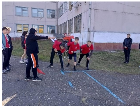
На фото: бег 30 метров, сборная 10-11 классов

В итоге среди 1 и 2 классов 1 место завоевал 2 класс, а 2-е место - 1 класс. Среди 3 класса и двумя 4 «а», 4 «б» в упорной борьбе 1 место завоевал 4 «а» класс, 2 место - 3 класс, и 3 место занял 4 «б» класс. Все участники получили грамоты.