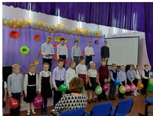
На фото: сводный хор

Сводный хор школы исполнил песню «Посвящение учителям» и «Поппури песен на слова Юрия Энтина», подняв настроение сидящим в зале.