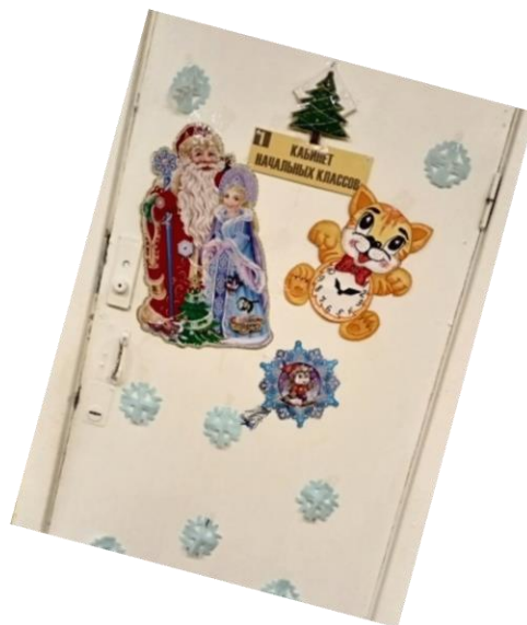
Оформление 2 «а» класса