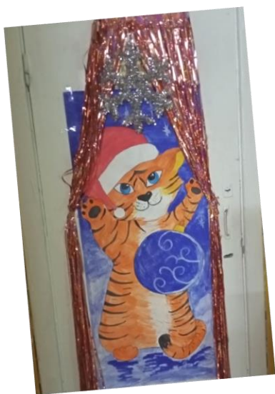
Тигр» б»б» класса