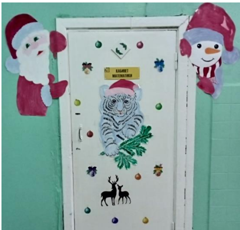
Оформление 5 класса