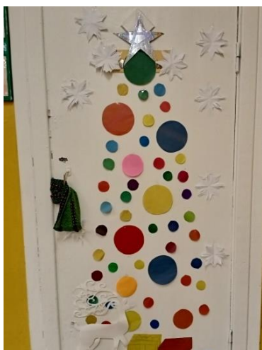
«Елочка» 3 класса