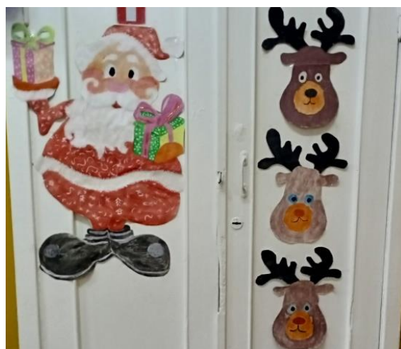
«Дед Мороз» 7 класса

За оформление дверей кабинетов все получили грамоты и сладкие призы.