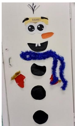
«Снеговичок» 10 класса