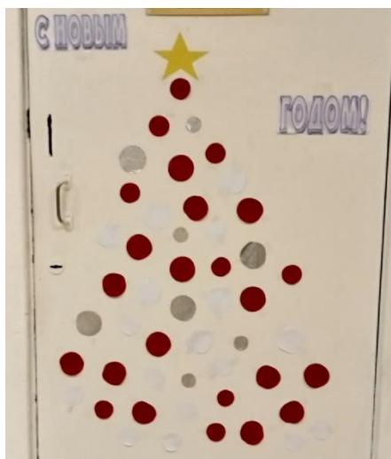
Новогодняя елочка 9 класса