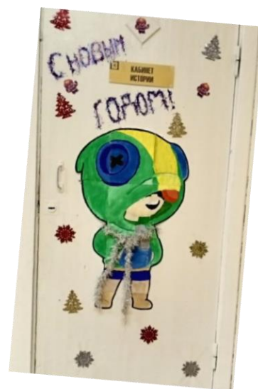
Оформление двери 8 класса