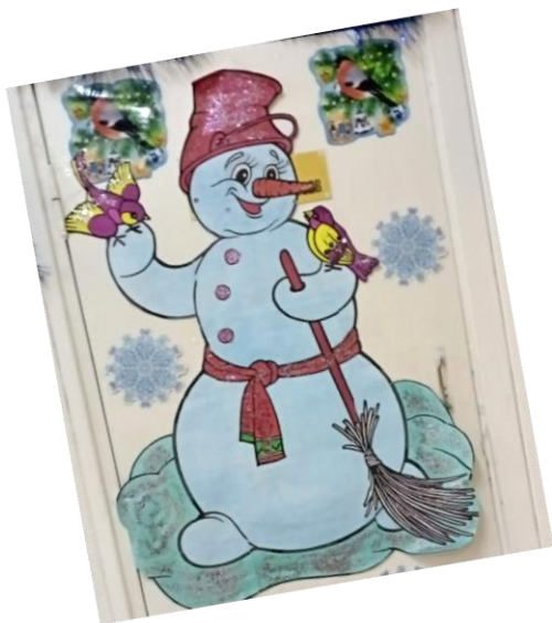
«Снеговик» 1 класса