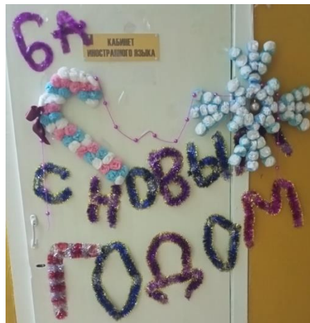
Двери б»а» класса