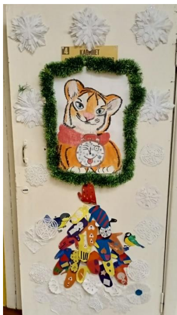
«Символ года» 4 «а» класса