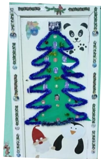
Елочка 11 класса